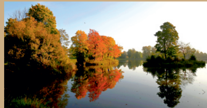
Malūno tvenkinys ir keturios jo salos.

Žvelgiant nuo Raudonųjų vartų alėjos pusės, tvenkinio salų siluetai piešte piešia M. K. Čiurlionio paveikslą „Ramybė“ kontūrus. Neveltui Rietavo kultūros paveldo puoselėtojai šioms saloms suteikė Ramybės, Vakarų ir Aukuro vardus.