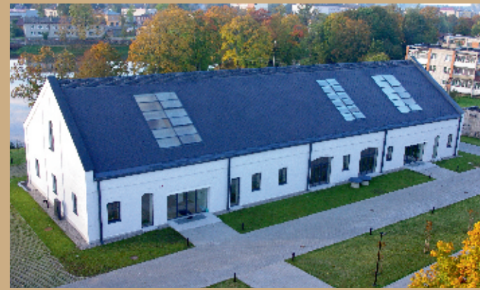
Rietavo kultūros centras, Rietavo turizmo ir verslo informacijos centras.

Rietavo turizmo ir verslo informacijos centras. Nuo 2018 m. kultūros centro koncertų salėse pristatomi ir tradicija tampa M. K. Čiurlionio kultūros kelio renginiai.