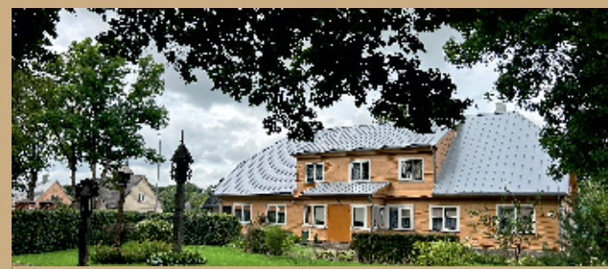
Senoji klebonija.