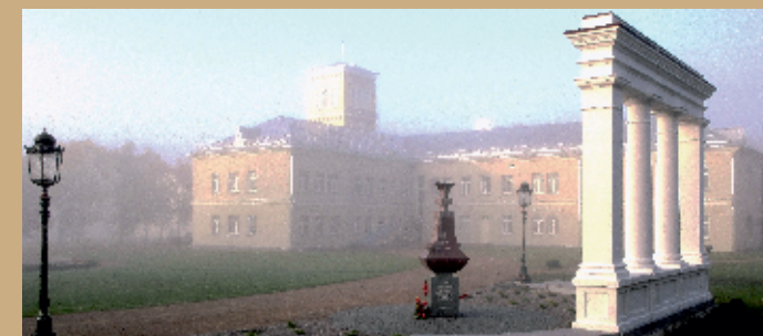
Buvusios kunigaikščių Oginskių rezidencijos rūmų kolonada ir paminklas.