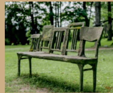
Sofijos suolelis Kuliuose.

Pastate, vietinių kuliškių vadinamame „raudonaisiais mūrais“, įrengtas Sofijos atminimui skirtas kambarėlis. Šalia esančiame parke pastatytas Sofijai dedikuotas suolelis (aut. skulptorius Mykolas Sauka), įprasminantis jos ryšį su Kulių miesteliu.