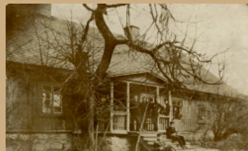
Išnykęs Plungės dvaro muzikantinės pastatas.