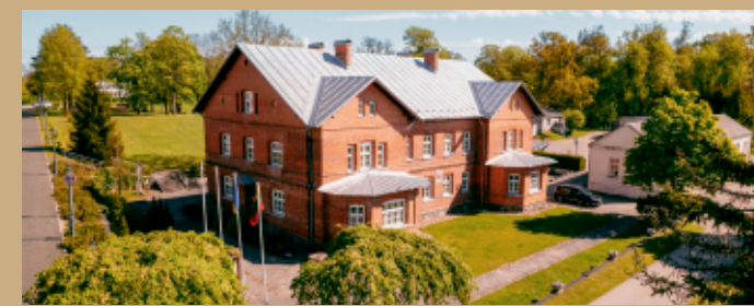
Rietavo Oginskių kultūros istorijos muziejus.

Tarpukariu istorinėje muzikantinėje buvo įsikūrusi Rietavo gimnazija, po II pasaulinio karo – vidurinė mokykla, 1973 m. pastatas buvo apleistas ir ilgai virto griuvėsiais. Prasidėjus naujam Lietuvos Atgimimui, šis kultūros istorijos paminklas prisikėlė naujam gyvenimui. 2000 m. čia įsikūrė Rietavo Oginskių kultūros istorijos muziejus. M. K. Čiurlionio kūrybinę aurą muziejuje primena teminės parodos ir edukaciniai-muzikiniai renginiai.