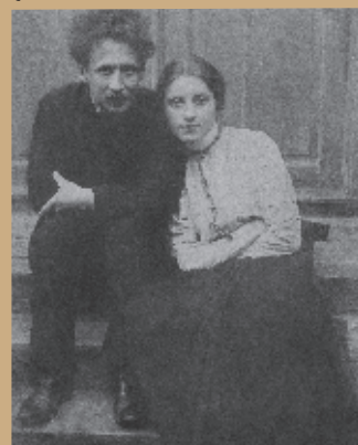
M. K. Čiurlionis ir S. Kymantaitė Plungėje 1909 m.