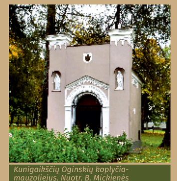
Kunigaikščių Oginskių koplyčia-mauzoliejus.