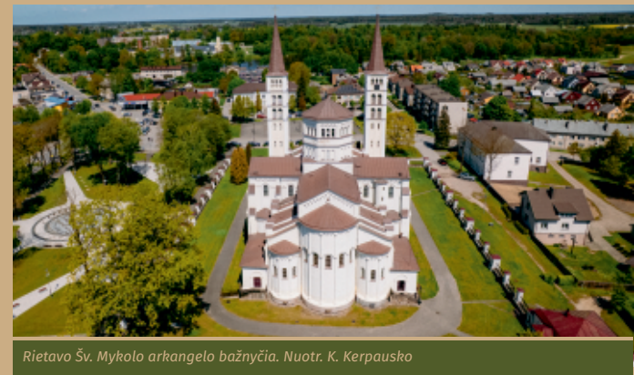
Rietavo Šv. Mykolo arkangelo bažnyčia.

1853-06-09 Žemaičių vyskupiui Motiejui Valančiui pašventinus kartinį akmenį, prasidėjo didieji statybos darbai, kurie užsitęsė daugiau kaip 20 metų. Rietavo pasididžiavimas – istorinis šimto lempučių bažnyčios sietynas, kuriame 1892-04-17 Šv. Velykų rytmetį pirmą kartą nušvito elektros šviesa. Šių iškilmių metu jungtiniame Rietavo ir Plungės orkestre griežė ir M. K. Čiurlionis.