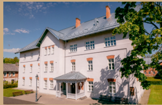
Rietavo Mykolo Kleopo Oginskio meno mokykla.

Šiame pastate XIX a. gyveno kunigaikščio Bogdano Oginskio muzikos mokyklos ir orkestro muzikantai. Atvykę iš Plungės čia apsistodavo ir kunigaikščio Mykolo Oginskio orkestro muzikantai. Tarp jų ir Mikalojus Konstantinas Čiurlionis, kuris Plungės muzikantinėje mokėsi 1889-1893 m.