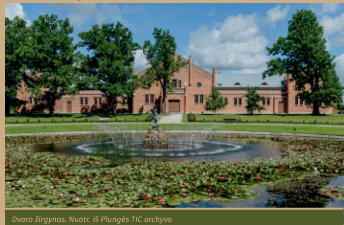
Dvaro žirgynas.

Neogotikinio stiliaus M. Oginskio dvaro žirgyne kiekvieną rugsėjį skamba muzika bei vyksta Tarptautinis Mykolo Oginskio festivalis – vienas ryškiausių klasikinės muzikos renginių Lietuvoje. Festivalio metu ypatingas dėmesys skiriamas M. K. Čiurlionio kūrybai ir muzikai.