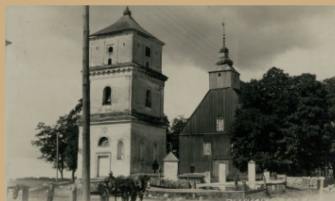
Senoji medinė Plungės bažnyčia XX a. 3 dešimt. – 4 dešimt.

Paauglys M. K. Čiurlionis kartu su kitais dvaro orkestro mokyklos mokiniais grodavo bei giedodavo senosios Šv. Jono Krikštytojo bažnyčios, kuri, šalia pastačius naująją, 1934 m. buvo nugriauta, chore. O 1909 m. vasarą sugrįžęs į Plungę su žmona Sofija, M. K. Čiurlionis į šią bažnyčią grįžo kitame amplua – kaip talentingas vargonininkas, kurio jausminga muzika sukurdavo nepamirštamą atmosferą, atrodydavo, kad net senutėlės bažnyčios stogas kilnojasi.