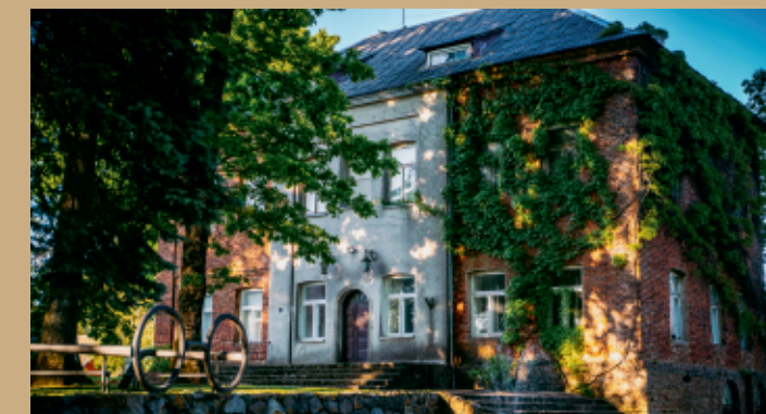
Kulių „raudonieji mūrai“.