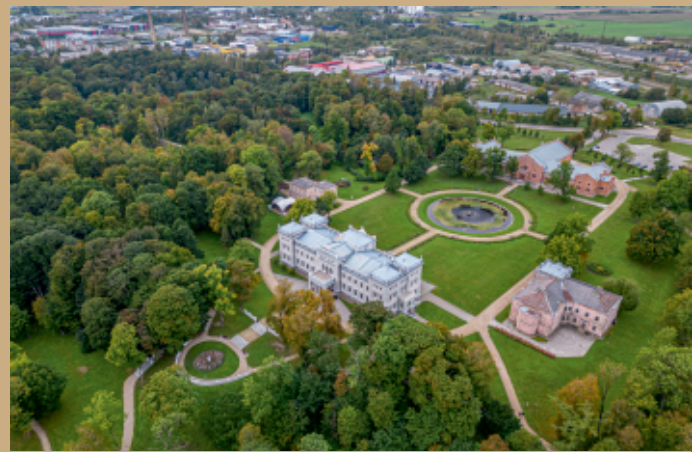
Plungės dvaro sodyba.

Šiandien M. K. Čiurlionio dvasią galite pajusti ne tik vaikščiodami po išlikusį 58,3 ha Plungės dvaro parką, bet ir apsilankę rūmuose veikiančiame Žemaičių dailės muziejuje. Čia įrengta kompozitoriui skirta ekspozicija, kurioje eksponuojama istorinė medžiaga, nušviečianti menininko kūrybos ir gyvenimo pėdsakus Plungėje. Lankytojai gali išvysti išskirtinį eksponatą – „C. Bechstein“ firmos pianiną, kuriuo grojo jaunas M. K. Čiurlionis.