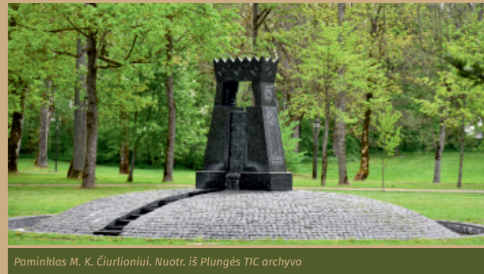
Paminklas M. K. Čiurlioniui.