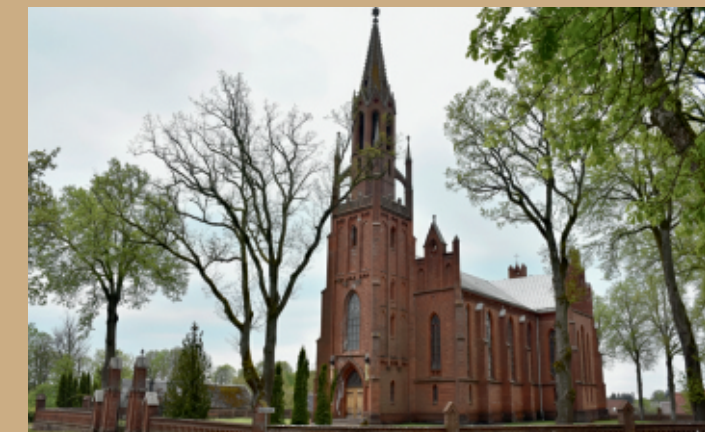
Šateikių bažnyčia.

„Naujieji Metai, Naujas Gyvenimas, Nauja Kalba, Nauji Pasauliai... Stebuklingesnės dienos neįmanoma išgavoti...“ – apie savo vestuves rašė M. K. Čiurlionis.