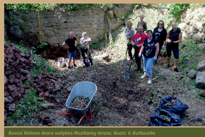
Buvusi Rietavo dvaro sodybos Muzikantų terasa.

XX a. pradžioje, užgesus muzikinėms Rietavo tradicijoms, sunyko ir Muzikantų terasa. Sovietmečiu buvo išgriauti ir ledainės rūsių skliautai. Šiuo metu Rietavo kultūros puoselėtojai imasi konkrečių veiksnių Muzikantų terasos atkūrimui, siekiant, kad čia vėl skambėtų orkestro muzikiniai akordai.