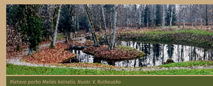
Rietavo parko Meilės kalnelis.

Kalnelio papėdėje tyvuliuoja Meilės ašarų tvenkinėlis primenantis, kiek ašarų dvaro panelės kitados čia išliejo besilgėdamas savo išrinktųjų.